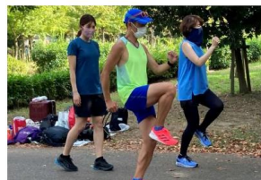
ランニングドリルの様子